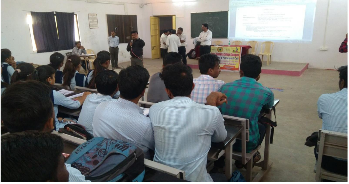
WIPRO campus drive 23/04/2019