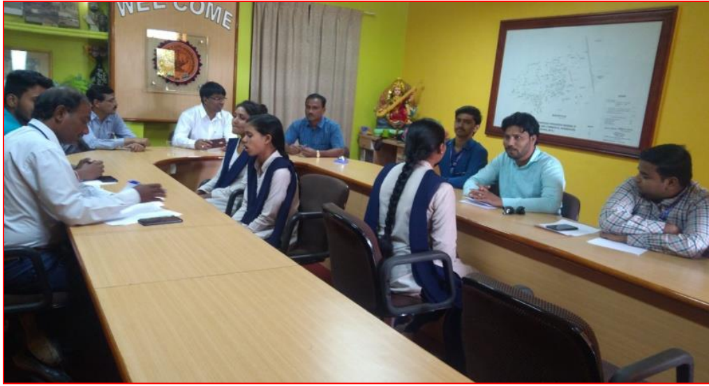
Figure 2 Microspectra campus Photo.