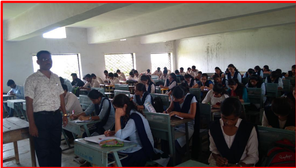
Students participated in aptitude test in G S College on 21/07/2018.