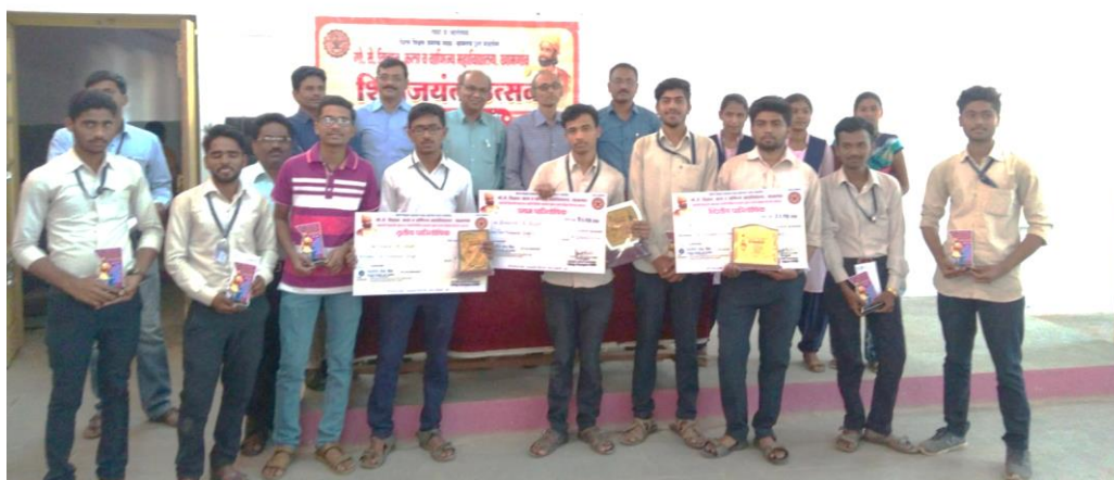
Group Photo who got prize in Shiv Jayanti competitive test held on 15/02/2019