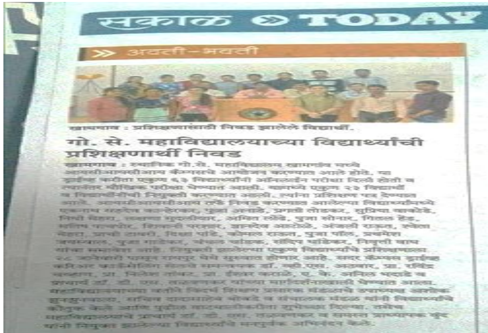
ICICI News Sakal news paper