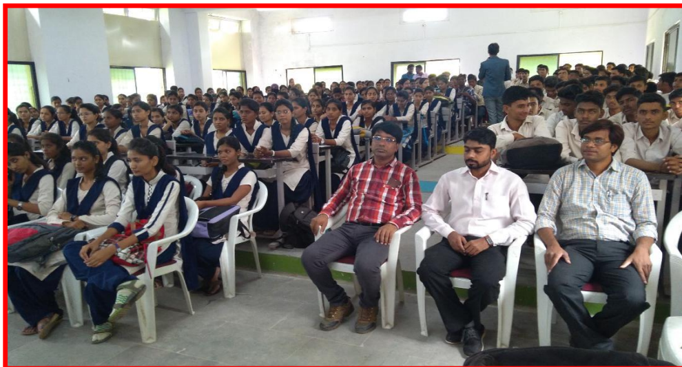
B. SC. I Students