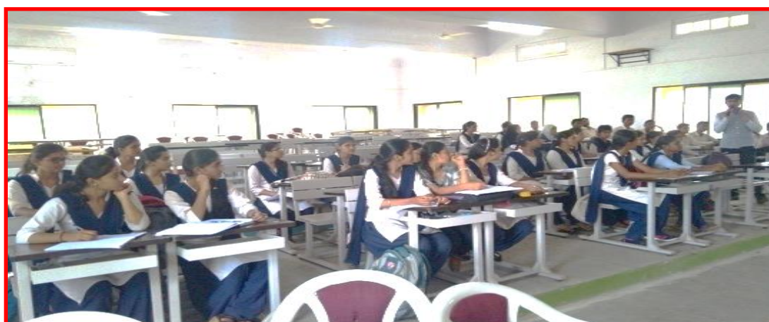
First lecture of soft skill development course on 25/08/2018