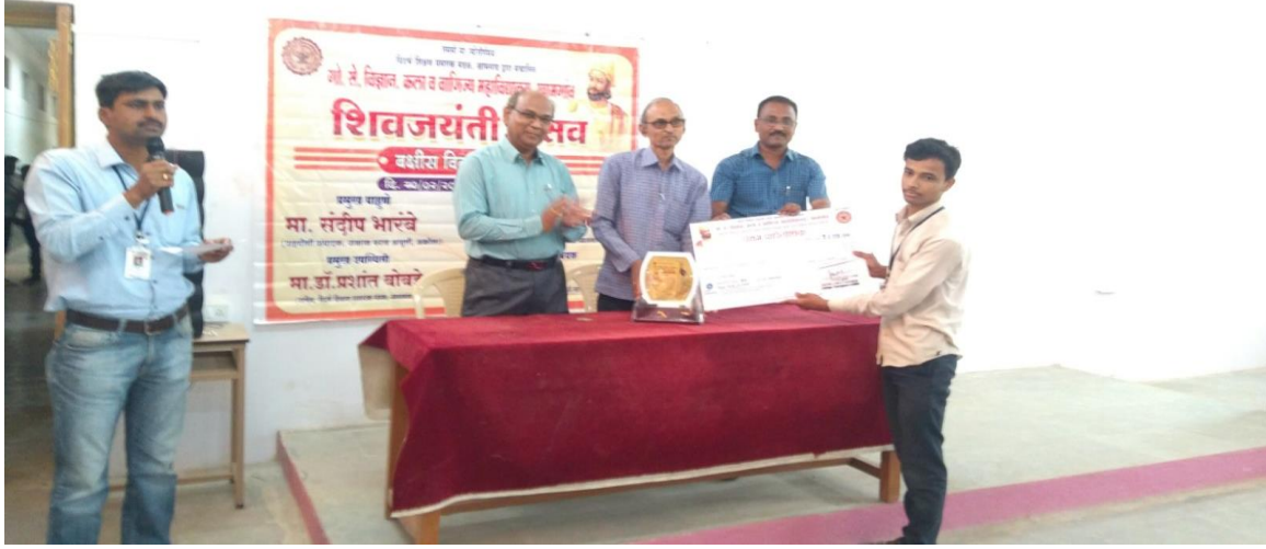
Got I Prize of Rs 2000/-