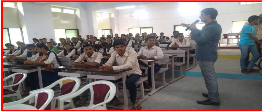
B. Com. I Students