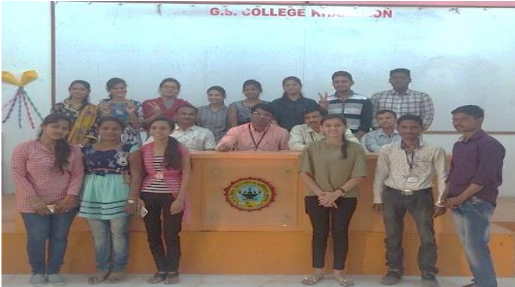
Selected List of Students.