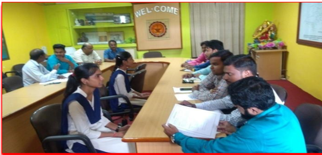
Microspectra campus Photo.